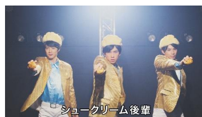
音楽がスタートし、シュークリーム後輩の3人が登場