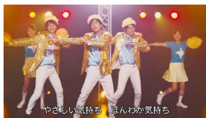
息の合った(?)ダンスを見せるメンバー