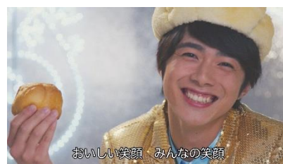
おいしい笑顔 みんなの笑顔