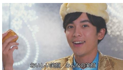
おいしい笑顔 みんなの笑顔