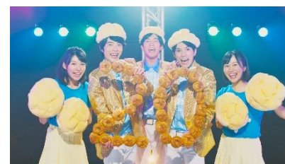
「牛乳と卵のシュークリーム」の20周年を記念して決めポーズ