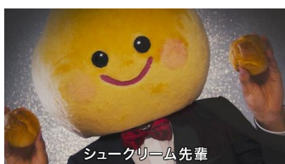
シュークリーム先輩の登場シーンから映像がスタート