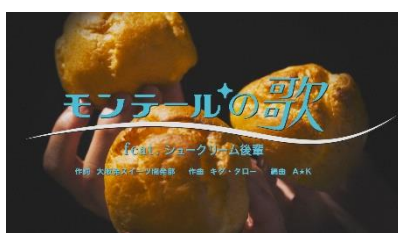
シュークリームを持つ3人の手とタイトル画面