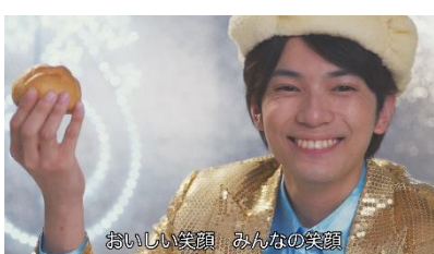
おいしい笑顔 みんなの笑顔